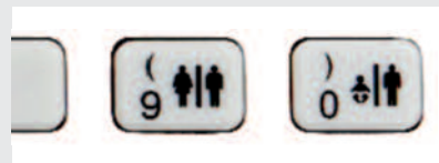
Zrychlená volba pohlaví a věkové skupiny