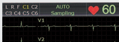
Displej s vysokým rozlišením a zobrazením mřížky