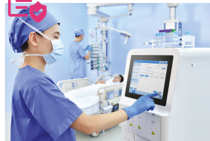
3. Spuštění testu