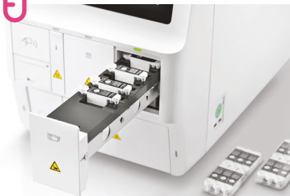
1. Vložení kazety