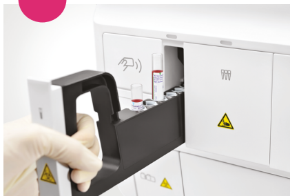
2. Vložení vzorku